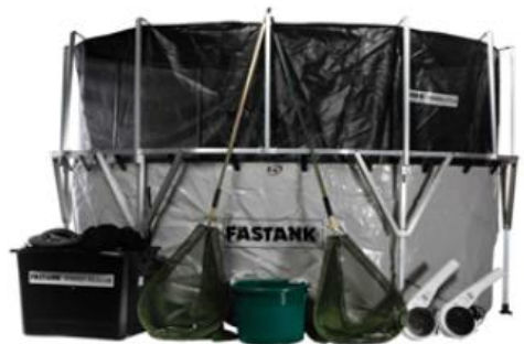
图：常见港口溢油围控回收设备

注：溢油应急设备一般以一对出现，常一用一备，也可以同时征用。以上设备不包括辅助船只。船只可在应急时征用临时船只，只要选择合适船只，不会影响设备使用。推荐将上述设备集装箱化，方便储备、维护、动员、使用。