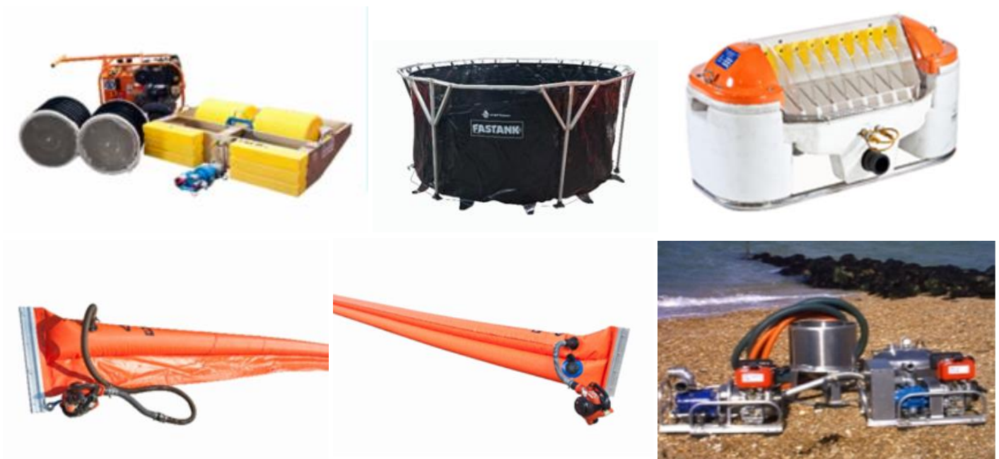
图：常见岸滩保护与清理设备