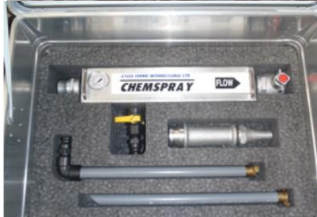
图：常见海上船用消油剂喷洒设备